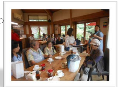
(レストランオソロク倶楽部)

そこで生き生き働くメンバー、職員の姿を目の当たりにし、このレストランで美味しいパンとピザを食べてきました。